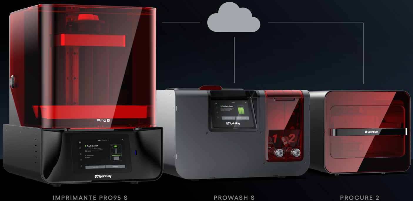
IMPRIMANTE PRO95 S

Lorsque vous lancez un travail d'impression, vous activez un écosystème de production complet qui surveille l'avancement des travaux et assure le suivi des instructions. Avec SprintRay Cloud, vos appareils transmettent automatiquement les informations relatives au travail du début à la fin. C'est une solution simple à zéro friction.